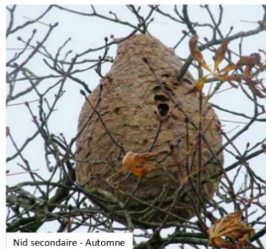
Nid secondaire - Automne

Le piégeage de printemps est un moyen de lutte préventif efficace.