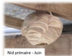
Nid primaire - Juin