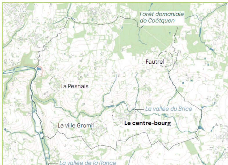
Carte de Les Champs-Géraux

Première rencontre le mardi 23 juin 2026 entre 16h et 20h sur la place de la mairie :